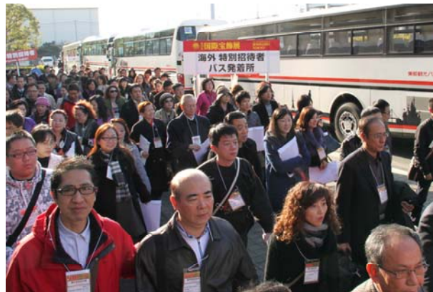
(IJT 2011 을 방문한 해외 프리미엄 바이어)

이로써 한국, 중국, 대만, 홍콩 및 기타 지역에서 IJT 를 방문하는 전문 무역 바이어 의 수가 현저히 늘 것으로 예상되며, IJT 가 시장 성장을 위한 매개체가 되어 경기 활성화에 일조할 것으로 생각합니다.