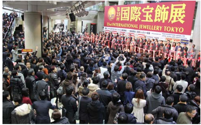
오프닝 테이프 커팅식

세계적인 경기 침체에도 불구하고 IJT는 다른 어떤 전시회보다 호황을 맞이하였습니다. 전시회 기간 4일 동안 일본 전역과 아시아 각지에서 주얼리 전문가 33,872명이 방문하였는데 놀랄만한 것은 방문 인원 수 뿐만 아니라 애스미에스텔, 츠즈미, 베리테, 스톤마켓과 같은 대형 주얼리 체인기업부터 중소 도시의 소규모 액세서리 샵까지 일본 곳곳에서 유수의 바이어들이 IJT를 방문했으며, 한 해 첫 주얼리 구매를 위해 매우 중요하게 인식하고 있다는 점에서 질적으로도 IJT가 매우 영향력이 있음을 시사하고 있습니다. 실지로, 대형 주얼리 체인 대표자들은 49명의 고위 인사들과 함께 오프닝 테이프 커팅식에 참석하기도 하였습니다. 이러한 고위 인사들의 IJT 참석은 결코 우연이 아니라 바이어를 초대하기 위한 사무국의 끊임없는 노력의 결과라고 할 수 있습니다. 출전사의 상품 정보를 담은 팸플릿을 IJT 시작 전에 대량으로 배포하였고 특별히 배정된 스태프들이 전시회 시작 수 주 전부터 바이어 한 분 한 분께 전화를 통해 초청 및 방문에 대해 안내 하는 등 사무국은 전시회에서 비즈니스를 활성화시키기 위해 주력 하였습니다.