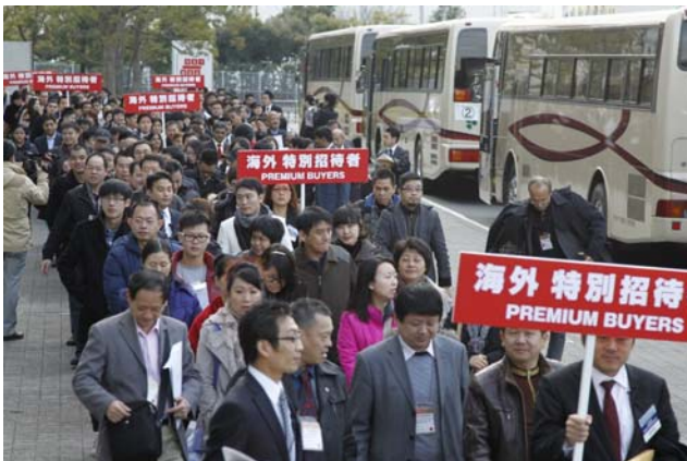
19대의 버스로 해외 프리미엄 바이어가 전시장에 도착한 모습

최근 몇 년간 IJT를 찾는 해외 바이어의 수가 늘고 있습니다. 세계 각국 특히 아시아를 중심으로 약 3,000여명의 바이어가 이번 IJT를 방문하였고 그 중 1,000명은 중국, 대만, 홍콩, 한국, 인도를 포함한 세계 각국에서 사무국이 초대해 특별 바이어들이었습니다. 특히 인도의 경우는 인도 내 4곳의 주얼리 협회의 협력으로 작년 대비 두 배가 넘는 바이어가 IJT를 방문했습니다. IJT의 높은 품질, 방대한 선택의 폭, 세련된 디자인, 경쟁력 있는 가격은 마치 자석의 흡인력처럼 바이어를 불러 모으고 있습니다. 나아가, 바이어들의 현장 구매를 더욱 활성화하기 위해 사무국은 통역을 포함한 구매 안내 서비스를 제공 하였는데 진주, 다이아몬드, 플래티넘 주얼리 및 고품질 유색보석 등을 선호하는 바이어들에게 매우 효과적이었습니다.