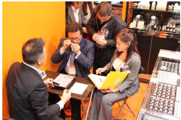
사무국이 지원하는 특별 서비스를 통해 많은 해외 바이어가 적극적으로 상품을 구입.