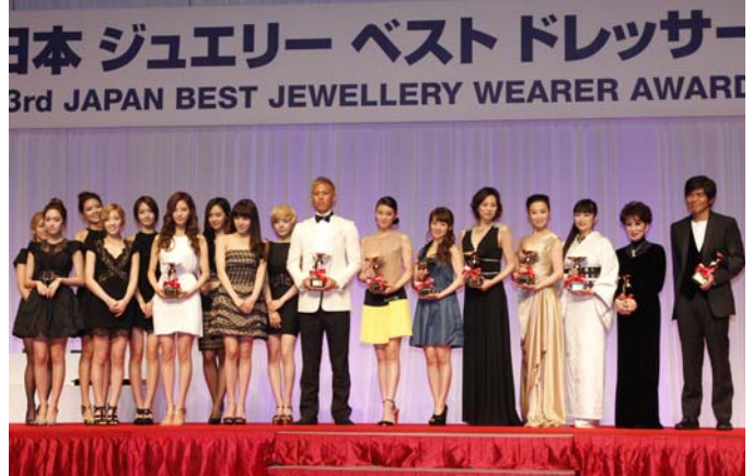
제 23 회 일본 베스트 주얼리 드레서 시상식 수상자들