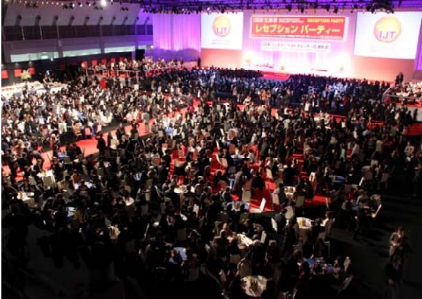
2000 여명의 주얼리 업계인들이 참가한 리셉션 파티

활발한 활동을 보인 일본 내 유명인에게 상을 시상하는 자리입니다. 이번 IJT 에서는 유명 축구 선수인 혼다 케이스케, 한국 인기 걸그룹 소녀시대를 포함하여 총 9 개 부문에 걸쳐 시상하였습니다. 파티가 열린 저녁 시간대에는 텔레비전과 라디오 방송 채널, 패션 관련 매스컴 관계자 200 여명이 뜨거운 취재 열기를 펼쳤으며, 일본 전역으로 방송되기도 하였습니다.