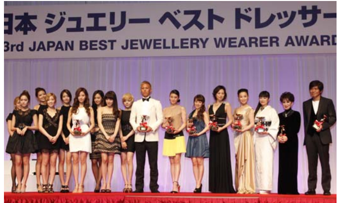
第 23 届日本最佳珠宝佩戴奖 获奖者