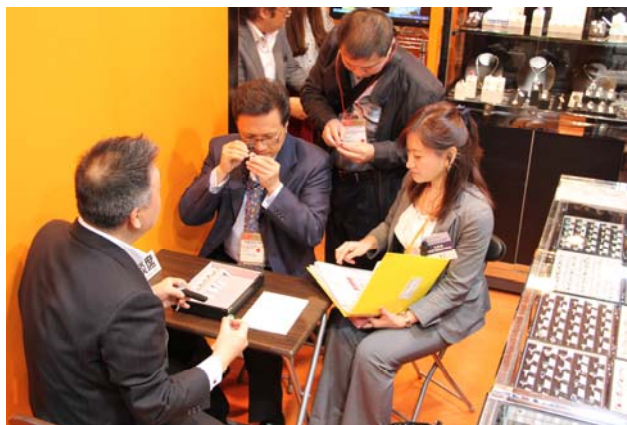
多数海外买家利用主办单位提供的配对服务积极采购高品质珠宝