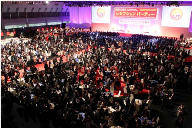
招待晚宴吸引了 2,000 名珠宝业界的领先人士

每年 IJT 吸引了大批媒体采访不单是因为大型国际珠宝展览以外，还有另外一项具有魅力话题的「日本最佳珠宝佩戴奖」与招待晚宴。今年也不意外。IJT 招待晚宴吸引了超过 2,000 名观众参加，会场上可与珠宝业界相关重要人士交流拓展人际关系。「日本最佳珠宝佩戴奖」已经有 23 年的历史，每年颁发给当年度最具有新闻价值的话题人物，并赠予高级珠宝更加突显明星丰采。今年的颁奖分为 9 个类别，其中包含了知名足球选手-本田圭佑和韩国人气流行女组合-少女时代。当天晚宴吸引了超过 200 家的电视、广播、广告杂志等媒体大肆报导，成为日本全国新闻话题。