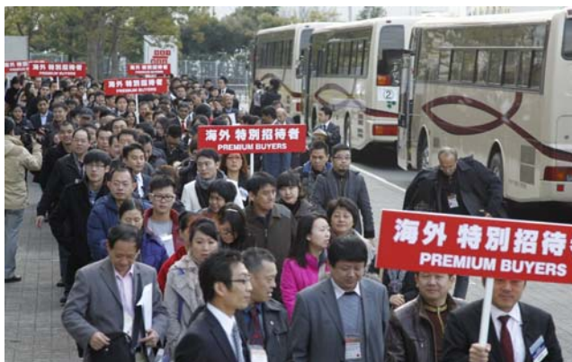
19 台巴士帶著海外超級買家蒞臨會場。

前來 IJT 採購珠寶的國際買家數字近年來年年上升。今年將近 3000 位來自世界各地的買家前來採購，其中尤以亞洲最受矚目。主辦單位更特別邀請近 1000 名超級買家，包含來自中國、台灣、香港、韓國與印度。特別是來自印度的買家數字近年來呈倍數增長，要特別感謝 4 個珠寶協會合力組團。高質量、多樣選擇、完美設計、具備競爭價格優勢宛如強力磁鐵吸引國際買家前來 IJT 採購珠寶。此外，為促進展場內商談順利，主辦單位也為超級買家提供貼心服務，包含協助翻譯。海外買家最有興趣的產品是珍珠、鑽石、鉑金首飾與各式高品質彩色寶石。