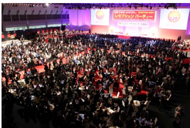
招待晚宴吸引了 2,000 名的珠寶業界的頂尖人士

每年 IJT 吸引了大批媒體採訪不單是因為大型國際珠寶展覽以外，還有另外一項具有魅力話題的「日本最佳珠寶佩戴獎」與招待晚宴。今年也不意外。IJT 招待晚宴吸引了超過 2,000 名觀眾參加，會場上可與珠寶業界相關重要人士交流拓展人際關係。「日本最佳珠寶佩戴獎」已經有 23 年的歷史，每年頒發給當年度最具有新聞價值的話題人物，並贈予高級珠寶更加突顯明星丰采。今年的頒獎分為 9 個類別，其中包含了知名足球選手-本田圭祐和韓國人氣流行女組合-少女時代。當天晚宴吸引了超過 200 家的電視、廣播、廣告雜誌等媒體大肆報導，成為日本全國新聞話題。