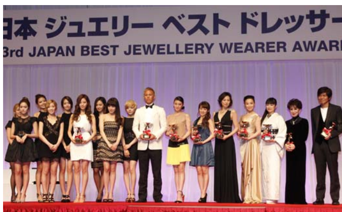
第 23 屆日本最佳珠寶佩戴獎 得獎者