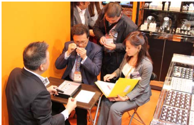
多數海外買家利用主辦單位提供的配對服務積極採購高品質珠寶。