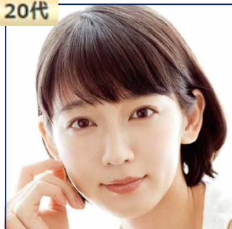
吉岡 里帆 (女優)