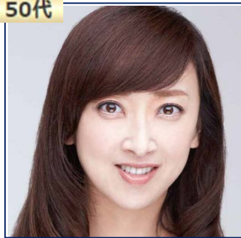
紫吹 淳 (女優)