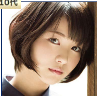
浜辺 美波 (女優)