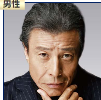
館 ひろし (俳優)