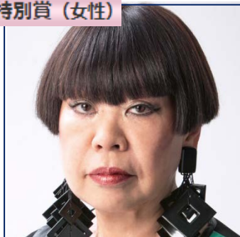
コシノ ジュンコ (デザイナー)