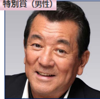
加山 雄三 (俳優・歌手)