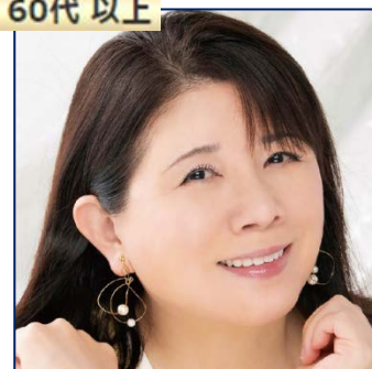
森 昌子 (歌手)