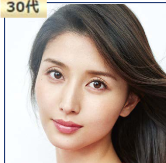
橋本 マナミ (タレント・女優)