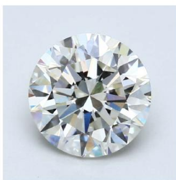
SISHU INTERNATIONAL HK LTD. (香港)