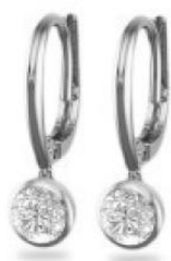
FENIX DIAMONDS LLC (アメリカ)